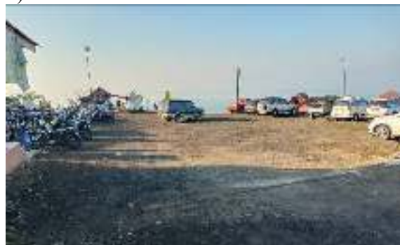
Gambar 5. Area Parkir Luas

2) Harga Tiket Masuk (HTM); harga tiket masuk ke lokasi ini sangat terjangkau yaitu Rp 5.000,- per orang di hari kerja (weekdays), Rp 10.000,- per orang di hari sabtu dan minggu (weekend) atau di hari libur nasional, serta Rp.15.000,- per orang di malam tahun baru: 3) Tersedianya lahan parkir yang cukup luas (seperti ditunjukkan pada gambar 5)