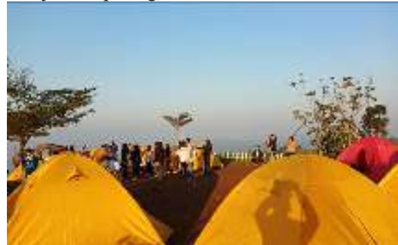
Gambar 8. Area Camping Dengan Fasilitas Tenda

dengan memanfaatkan bentangan alam yang berbukit. Sedangkan untuk area camping terdiri ada tiga tingkat. Area untuk camping seperti ditunjukkan pada gambar 8