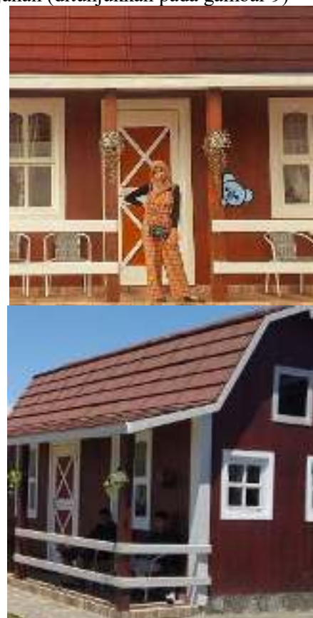
Gambar 9. Fasilitas Resort

Tersedianya resort sebanyak 10 unit, dengan ukuran rata-rata (4 x 6 meter), resort ini dilengkapi fasilitas seperti; karpet lantai untuk duduk bersantai, kursi dan meja kecil, dispenser untuk air minum, kamar mandi. Untuk harga sewa rumah penginapan di Germanggis Resort sekitar Rp. 500.000,- per malam. Hal ini memudahkan pengunjung yang ingin bermalam tanpa khawatir kehujanan (ditunjukkan pada gambar 9)