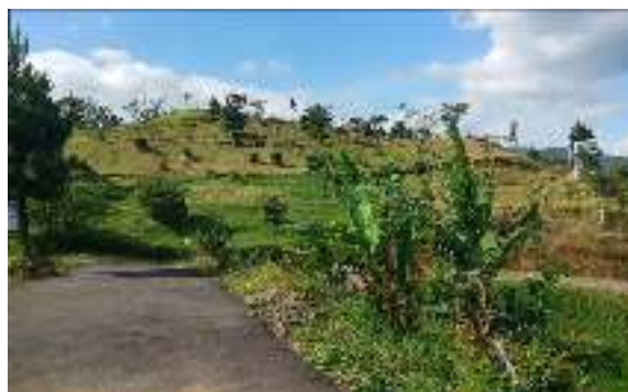
Gambar 1. Lahan yang masih luas

Lokasinya yang ada dilereng kaki Gunung Slamet ini, topografinya berbukit. Dengan kondisi alam seperti demikian, mengilhami penamaan tempat wisata, yaitu berasal dari kata “Ger” yang berarti Bukit dan “Manggis” berarti buah manggis. Tempat wisata Germanggis merupakan kawasan wisata alam berkonsep wisata fun education . Pengunjung bisa menikmati alam bebas yang sekaligus bisa mengadakan camping. Potensi dari Germanggis yaitu memiliki sumber alam yang sangat bagus dengan mata air yang cukup banyak, lokasi wisatanya berdiri diatas lahan seluas 5 hektar, dengan area yang sudah terpakai 1,5 hektar, dan masih ada sekitar 3,5 hektar lagi, untuk bisa dikembangkan (seperti ditunjukkan pada gambar 1)