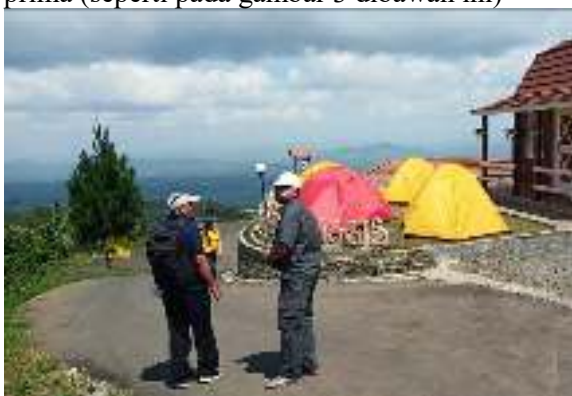
Gambar 3. Jalan menuju lokasi

Dalam pengelolaan tempat wisata ini terdapat beberapa faktor yang sementara menjadi penghambat, hal ini diantaranya dapat dianalisa sebagai berikut: 1) Lokasi tempat tersebut cukup jauh dari jalur kendaraan umum, sehingga bagi para pengunjung harus naik kendaraan pribadi baik motor, mobil MPV/ SUV, ataupun menyewa kendaraan bila berombongan seperti bus kecil, mobil ELF, sementara bus kapasitas besar (50 orang) belum bisa naik masuk kelokasi, 2) Walaupun jalannya beraspal hotmix , tetapi jalan menuju lokasi menanjak, jalannya naik dibeberapa titik dengan kemiringannya hampir 50 derajat, maka bagi pengunjung yang akan kelokasi, harus senantiasa mengecek kondisi kendaraan, dan memastikan dalam kondisi yang prima (seperti pada gambar 3 dibawah ini)