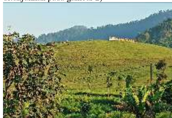
Gambar 2. Pemandangan alam sekitar yang indah

Selain itu udaranya masih terasa sangat sejuk, minim polusi udara, pandangan alamnya baik saat sunrise dan sunset pada cuaca terang sangat indah. Dengan kondisi seperti ini, lokasi wisata germanggis memiliki potensi yang bagus untuk dijadikan tempat prasarana aktivitas jasmani baik bagi siswa, guru maupun masyarakat umum (pemandangan alam sekitar yang indah ditunjukkan pada gambar 2)