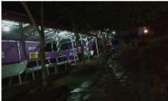
Gambar 6. Fasilitas Kantin

6) Banyak terdapat spot foto yang menarik, hal ini menjadi daya tarik tersendiri bagi para pengunjung, karena spotnya bervariasi (seperti ditunjukkan pada gambar 7).