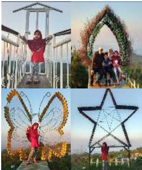
Gambar 7. Lokasi Spot Foto

6) Banyak terdapat spot foto yang menarik, hal ini menjadi daya tarik tersendiri bagi para pengunjung, karena spotnya bervariasi (seperti ditunjukkan pada gambar 7).