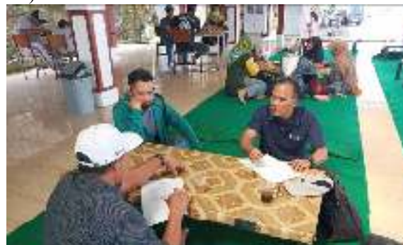
Gambar 4. Pelibatan warga sekitar

sebagai berikut: 1) Dukungan dari masyarakat dan pemerintah desa setempat, hal ini ditunjukkan dengan melibatkan sebagai penjaga parkir dan penjaga tiket serta warung makan (pelibatan warga sekitar dalam ikut mendukung usaha wisata, ditunjukkan seperti gambar 4, dibawah ini)