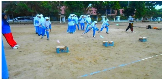
Gambar 8. Pelaksanaan Kegiatan Inti dengan Permainan Modifikasi Lempar Sasaran

Siswa dibagi menjadi enam kelompok, terdiri dari tiga kelompok laki-laki dan tiga kelompok perempuan yang jumlahnya sama banyak. Selanjutnya guru membagikan peluru yang dimodifikasi dan kardus kepada masing-masing kelompok, jarak kardus dengan kelompok antar 1-2 meter dan jarak kardus antara garis finish kurang lebih satu meter. Apabila guru telah memberikan aba-aba “ya”, maka masing-masing kelompok berusaha melempar kardus dengan peluru yang dimodifikasi. Pemenang ditentukan oleh kelompok yang mampu melempar kardus melewati garis finish. Proses pelaksanaan kegiatan ini dengan permainan modifikasi lempar sasaran dapat dilihat pada cuplikan atau gambar berikut ini: