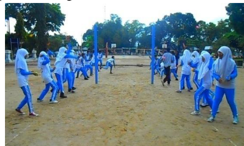
Gambar 7. Pelaksanaan Pemanasan Khusus dengan Permainan Modifikasi

Pemenang ditentukan oleh kelompok yang berhasil mempertahankan kawasannya dari serangan. Kelompok yang kalah yaitu kelompok yang tidak bisa melindungi kwasannya atau memiliki bola terbanyak dikawasannya. Guru memberikan hukuman kepada kelompok yang kalah sesuai dengan kesepakatan kelompok yang menang. Proses pelaksanaan pemanasan khusus dengan permainan modifikasi dapat dilihat pada cuplikan atau gambar berikut ini: