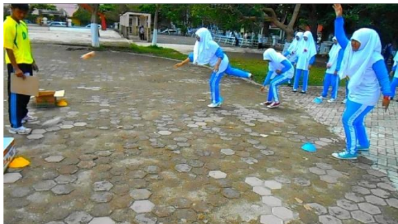
Gambar 11. Pelaksanaan Kegiatan Inti dengan Permainan Modifikasi

Selanjutnya siswa melakukan tolakan kearah kardus yang berada didepan kelompok setelah melakukan tolakan, siswa tersebut mengambil kembali peluru serta memberikan peluru kepada teman kelompok yang berada dibelakangnya, teman yang memperoleh peluru tersebut melakukan kegiatan seperti yang dilakukan teman sebelumnya dan begitu seterusnya. Proses pelaksanaan kegiatan inti dengan permainan modifikasi dapat dilihat pada cuplikan atau gambar berikut ini: