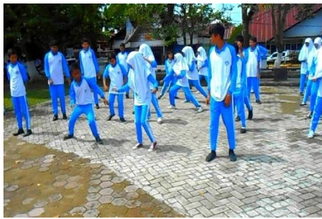
Gambar 9. Pelaksanaan Pemanasan Umum dengan Permainan Tradisional Angka Bergulir

dapat dilihat pada cuplikan atau gambar berikut ini: