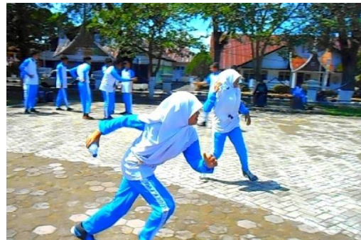
Gambar 10. Pelaksanaan Pemanasan Khusus dengan Permainan Modifikasi

kegiatan. Proses pelaksanaan pemanasan khusus dengan permainan modifikasi dapat dilihat pada cuplikan atau gambar berikut ini: