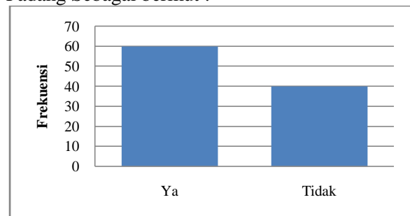
Gambar 4. Diagram Batang Distribusi Skor Sarana dan Prasarana

Pada gambar 4 di bawah ini diperlihatkan secara keseluruhan grafik Diagram Batang Sarana dan Prasarana di SD Negeri 22 Andalas Padang sebagai berikut :